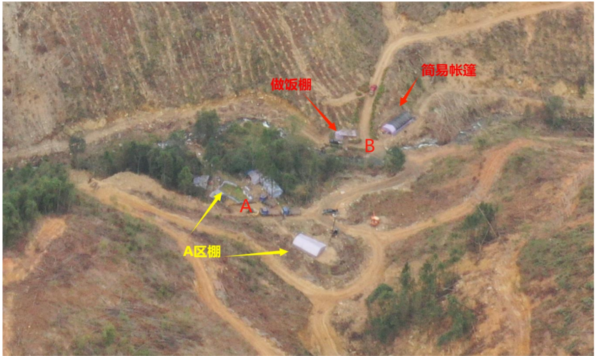
事发前工区布置情况（图 1）