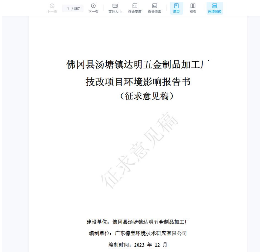
图 3-2 征求意见稿全本公示截图