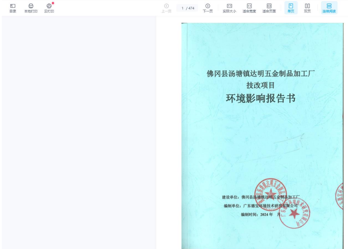
图 6-2 报批前网上环境影响报告书全文公开截图