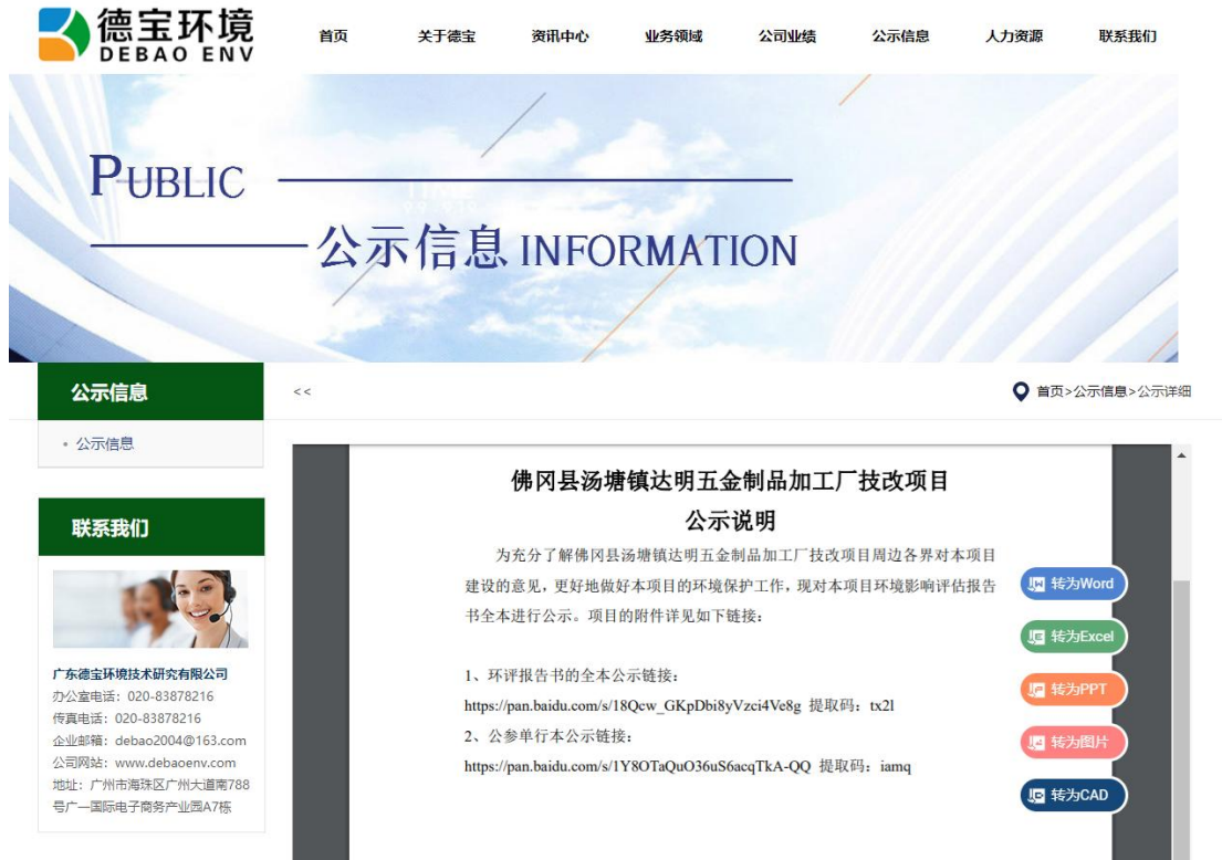
图 6-1 报批前网上公开截图

载体选取的符合性分析：项目报批前在环评单位网站于 2024 年 11 月 21 日网上公开拟报批的环境影响报告书全文和公众参与说明。因此项目报批前公开载体的选取符合《环境影响评价公众参与办法》要求。