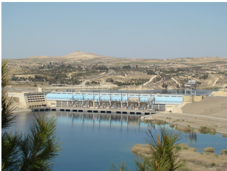
迪什林水电站发电机组

叙利亚移动通话费用相比同地区其他国家较低，但相对于本国民众平均收入较高。世界银行数据显示，2016年，叙利亚移动电话用户约1390万户，每百人拥有72部移动电话；固定电话用户近420万户，每百人拥有18.8部固定电话；互联网用户约300万户，宽带用户约20万户，占中东互联网市场的4.5%，每百人中固定宽带用户为5.48个。世界银行数据显示，2017年，叙利亚互联网使用人口占总人口的34.25%；固定带宽用户数从上年的101万增加值142.3万，普及率从上年的5.48%上升至7.79%；固定电话数量从上年的346.5万部减少至272.6万部，普及率从上年的18.8%下降至14.9%；手机拥有量从上年的1335万部增加至1538.6万部，普及率从上年的72.3%上升至84.2%。