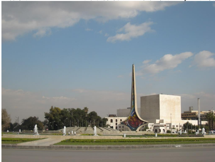
伍麦叶广场-叙利亚首都标志性建筑

【政府】叙利亚现政府成立于2000年3月13日，2001年12月13日、2003年9月18日、2004年10月4日、2006年2月11日、2007年12月8日和2011年4月14日第六次改组，现有31名成员。总统是国家元首，由人民议会选举产生，每届任期为7年，内阁是国家最高行政管理机构，由内阁会议主席和各部部长组成，内阁成员由总统任命并向总统负责。2014年8月，叙利亚总统再次任命哈勒吉(Wael Al-Halaki)担任总理。本届政府于2016年7月3日成立，2017年3月和2018年1月两次改组，有32名阁员，包括总理伊马德·哈米斯(Imad Khamis)，副总理兼外交与侨民部长瓦立德·穆阿利姆(Walid Al-Moualem)，国防部长阿里·艾尤布(Ali Ayoub)等。